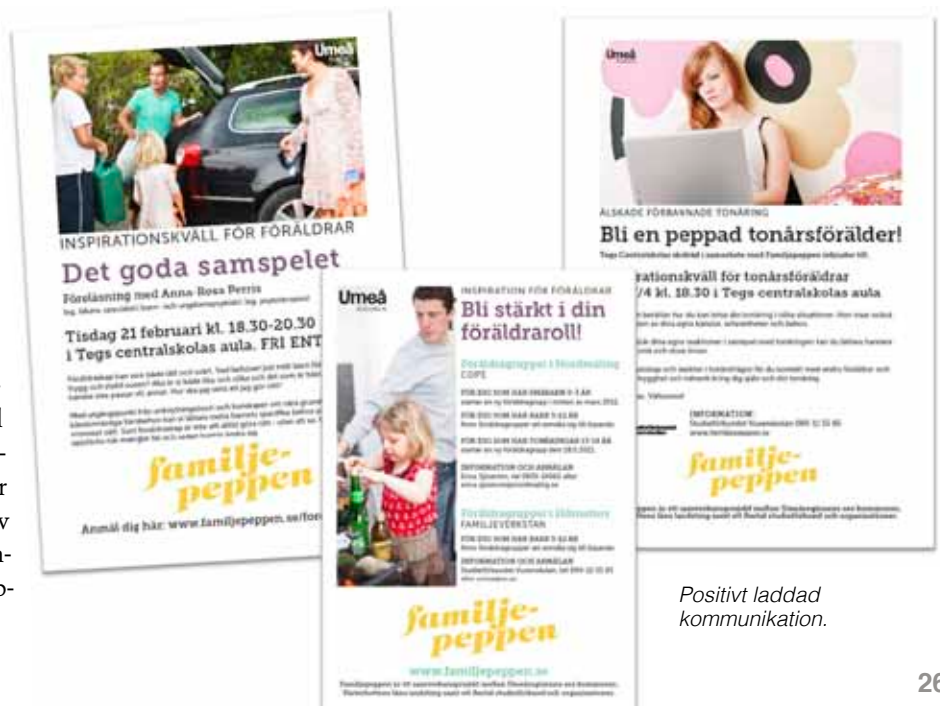
Positivt laddad kommunikation.

Kommunikationen av Familjepeppen, beskrev Anna-Lena Püschel, skedde på flera parallella plan. Man tog fram en egen webbplats för projektet www.familjepeppen.se med både generell information och lokal där varje kommun